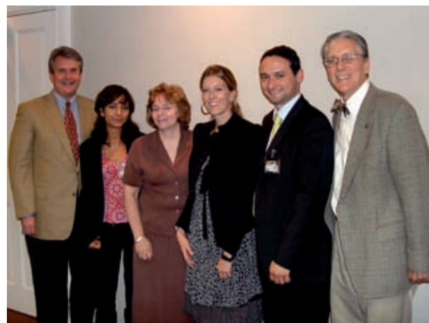
Team LUISS e VCU

Sono previste inoltre, a supporto dell'apprendimento, collaborazioni con istituzioni e organizzazioni di eccellenza della filiera della salute finalizzate al trasferimento di esperienze e best practice.